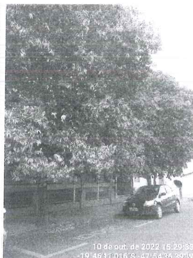
Oitizeiros a serem podados.