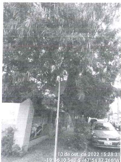
Leucena inclinada sob a unidade de saúde.